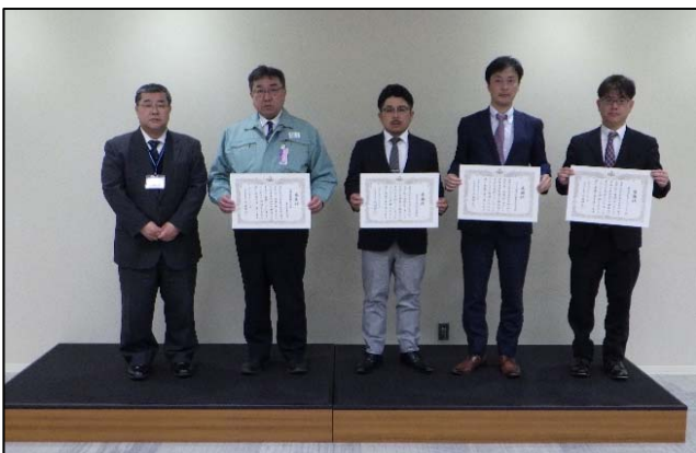
高白道路改良工事（その3） 元請 日鋪建設株式会社東北営業所 下請 株式会社阿部設備 ジェコス株式会社東北支店 株式会社オトワコーエイ