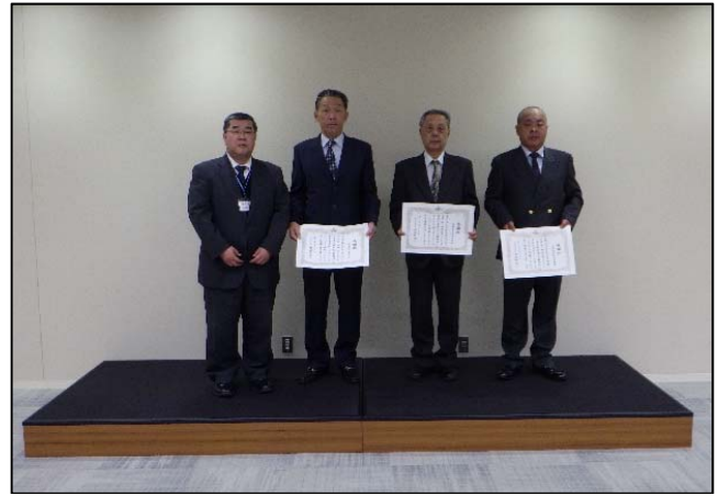
中野外道路災害緊急応急工事 元請：株式会社山内組 下請 雁部建設株式会社、有限会社東永重機 高橋商事株式会社、株式会社センボク