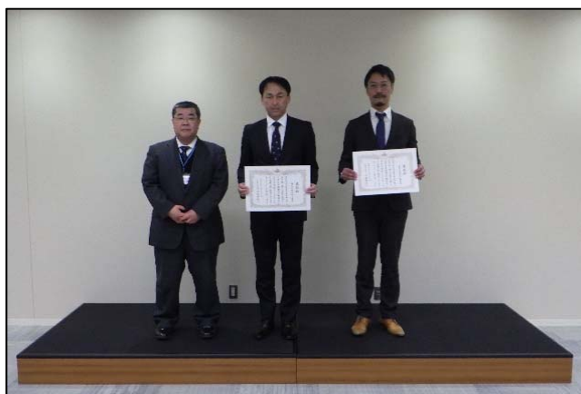
州崎地先海岸緊急大規模漂着流木等処理業務委託 (その1) (その2) 元請 株式会社木村土建 下請 株式会社森下興業