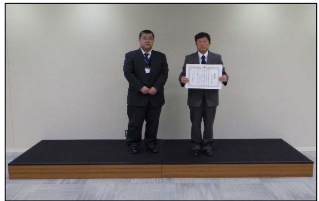
東松島地区道路管理業務委託 元請 株式会社和建設