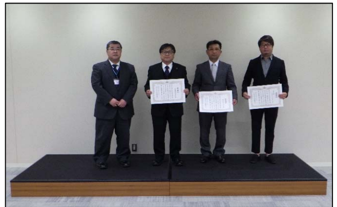
水沼川外4 河川災害応急仮工事 元請 遠藤興業株式会社 下請 株式会社アヴェンタ 株式会社MARUYOSHI