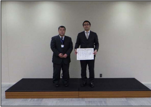
名振道路災害緊急応急工事 元請 佐藤建設株式会社