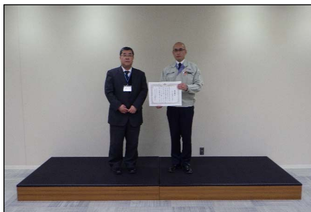
御前浜外道路災害緊急応急工事 元請 田中建設株式会社