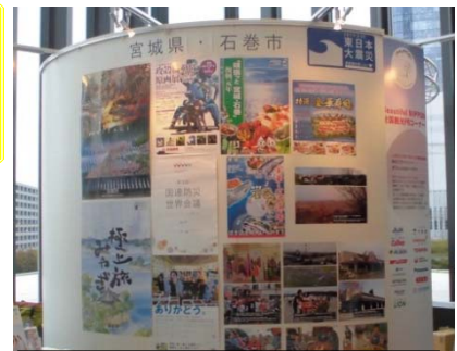
県と石巻市の展示ブース

平成27年3月6日～12日に東京スカイツリーで開催された東日本大震災復興パネル展に、当事務所からは、震災遺構の定川大橋の橋名板を出展し、3名の職員が東日本大震災の記憶を伝えるとともに、現在の復旧・復興状況を説明し、風化防止を訴えました。また、多くの方々に宮城県を訪れていただけるように、元気に観光PRを行いました。