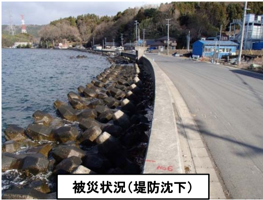
被災状況(堤防沈下)