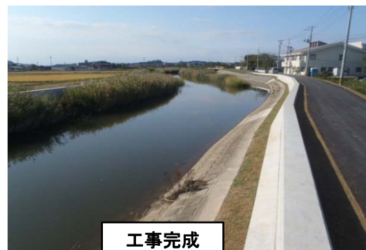
【金沢川 石巻市大瓜地内】