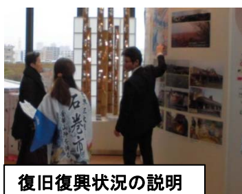
復旧復興状況の説明