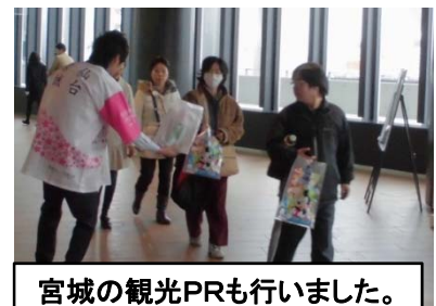
宮城の観光PRも行いました。