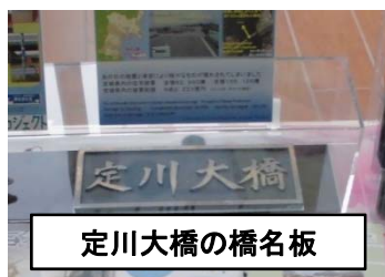
定川大橋の橋名板