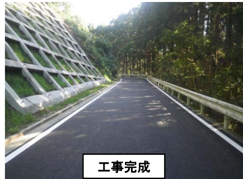
【(一)石巻雄勝線 石巻市真野地内】