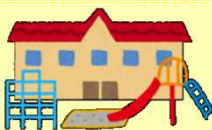
幼稚園・保育所等