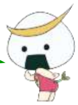
アニメむすび丸

平成26年度は、多くの皆様からご登録をいただきました。 社会全体でルルブルを推進していくために、それぞれの立場でできることを考え、実践してまいりましょう！ 次号は、平成27年度にご登録いただいた皆様をご紹介します。