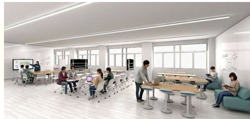
グループワーク、個別学習、先生と相談しながらの学習、発表等ができる教室、「ラーニングcommons」のイメージ