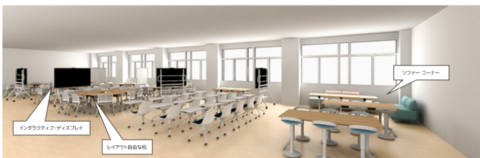
グループワーク、個別学習、先生と相談しながらの学習、発表などができる「ラーニングcommons」のイメージ

単位制ってなに? チューター制ってなに? クラスがないってどういうこと? 校内居場所カフェって? ラーニングcommonsって? 入試はどうなるの?