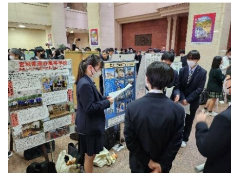
ポスターセッション