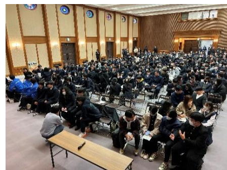
全体ディスカッション