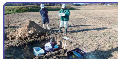
農地整備事業調査 岩淵地区 土壌調査の様子