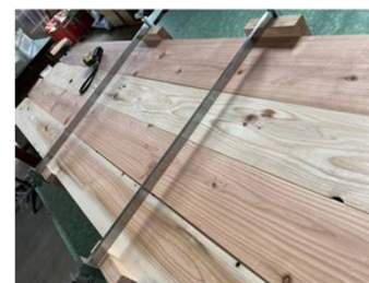
ボードの制作状況