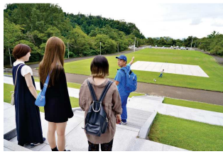
※将棋のまち天童サイクリングツアーの様子