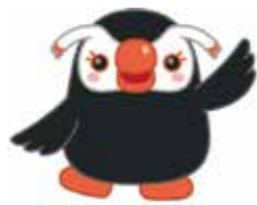
北方領土 イメージキャラクター 「エリカちゃん」