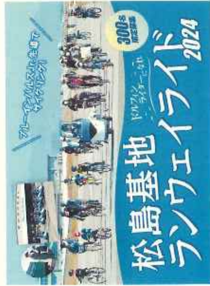
松島基地ランウェイ2024