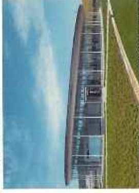
みやぎ東日本大震災津波伝承館