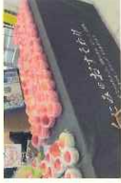
石巻合庁での国見町販売会