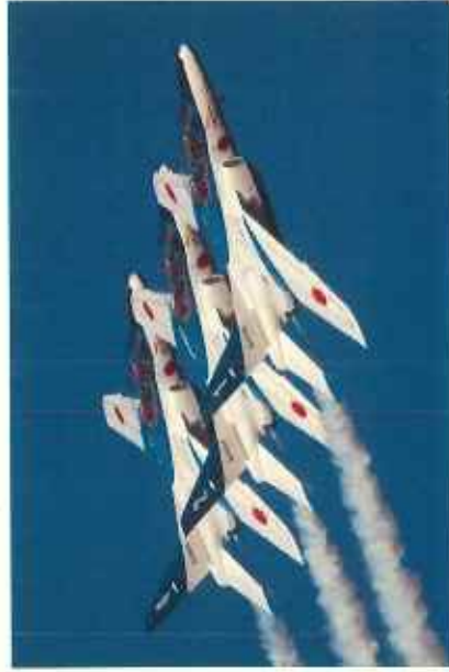
ブルーインパルス