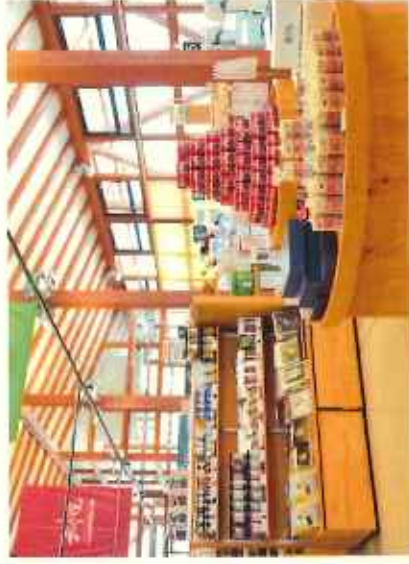
いしのまき元氣いちば