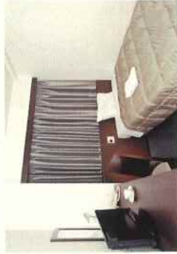
ビジネスホテル (石巻サンブラザホテル)