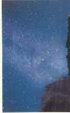
星空 (荒浜海水浴場)