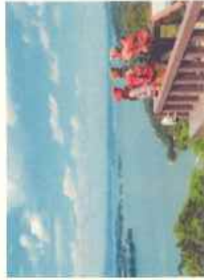
オルレ奥松島コース