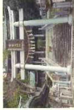
金華山黄金山神社