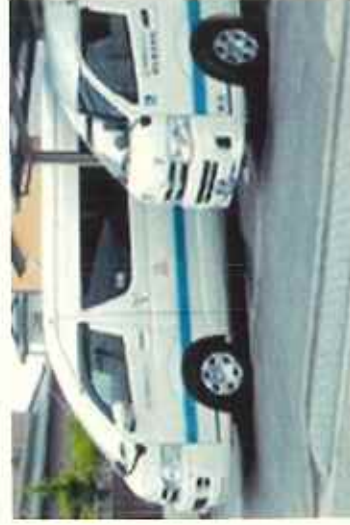
乗り合いタクシー (一般社団法人石巻市観光協会)