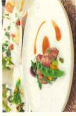
ホテルでの食事 (石巻グランドホテル)