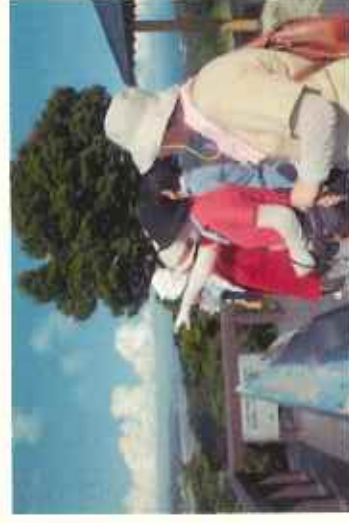
奥松島 (株式会社東松島観光物産公社)