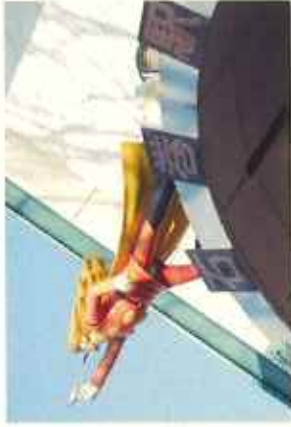
石巻マンガロード