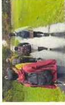
みちのく潮風トレイルスルーハイク