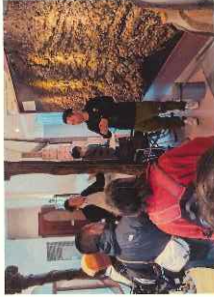
外国人ガイド研修会