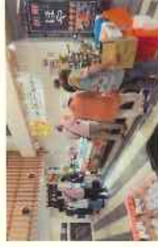
石巻地域の物産と観光展