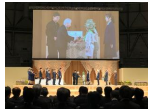
第47回全国育樹祭 式典行事（福井県）