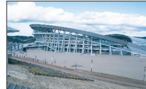
<例:大会・合宿等の県内誘致促進>

宮城の魅力発見、団体旅行の増加や地域経済活性化等様々なメリットがあるスポーツツーリズムを推進するため、県内へのスポーツ合宿等の誘致を目的としたバス助成金を交付する。