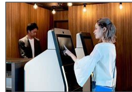
<例:スマートチェックインシステムの導入>

おもてなし態勢の向上を目指し、省力化やサービス水準の向上につながる設備導入経費への助成を行う。(例:清掃ロボット、宿泊施設管理システム、スマートチェックイン)