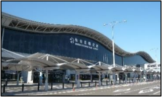
<例:仙台空港等のゲートウェイからの周遊促進>

二次交通の充実による周遊促進を目指し、バスツアー商品の造成やレンタカー等の利用促進を図るなど、観光地までのアクセス手段の最適化を図る。