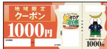
<例:地域限定クーポンによる消費喚起>

閑散期や長期滞在促進に向けたインセンティブとするとともに、地域の土産店、飲食店等での地域クーポンの利用により、地域経済活性化を促進する。