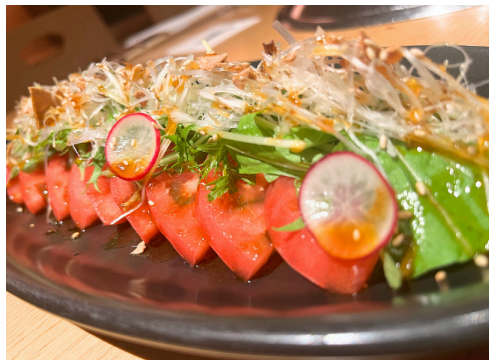
松島トマトのガーリックトマトサラダ