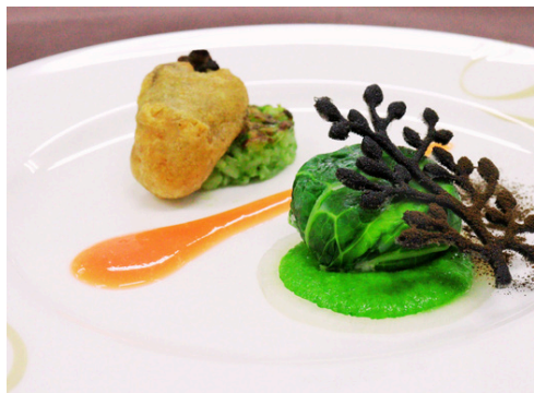
東松島市産牡蠣のフリット、色鮮やかな春菊の焼きリゾット、帆立貝のムースと牡蠣のサボイキャベツ包み