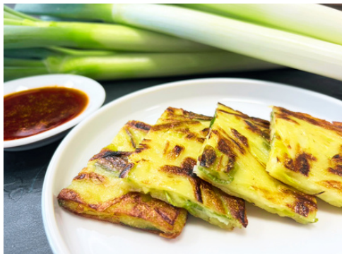
ねぎ豚にんにくチヂミ