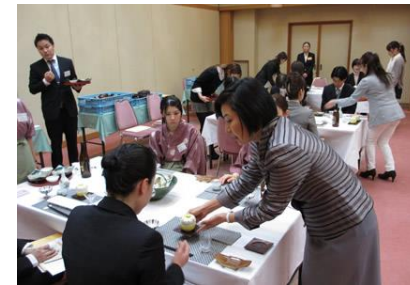
<スキルアップ研修(イメージ)>