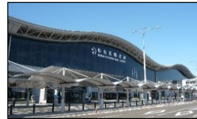
<仙台空港等のゲートウェイ>