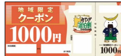
<地域クーポン(イメージ)>