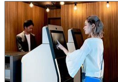
<スマートチェックインシステム (イメージ)>