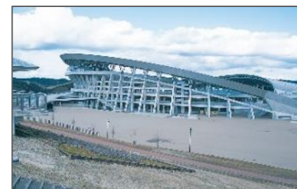
<大会・合宿等の県内誘致促進>