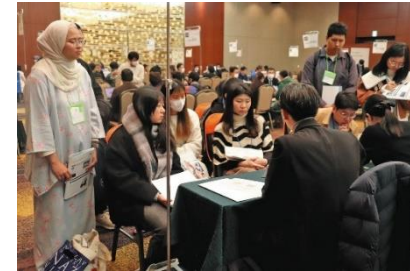
<宿泊事業者版ジョブフェア (イメージ)>