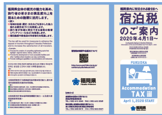
リーフレット（イメージ）