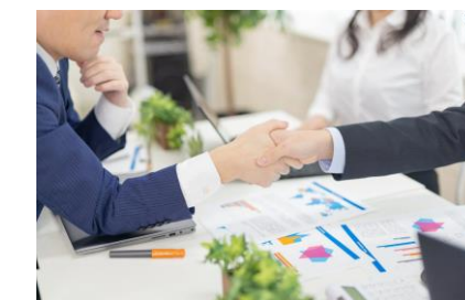
<商談会の開催(イメージ)>

②趣味やテーマ性が高い目的に絞ったSITに特化した海外旅行会社等とのマッチング商談会の開催