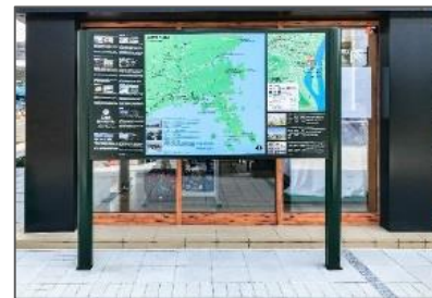
<多言語観光案内板(イメージ)>