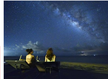
<地域資源を活用したコンテンツ造成(イメージ)>