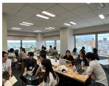
〈イメージ：グループワーク・発表会〉