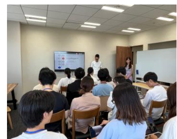
※写真は(株)Relic 過去の学生向けプログラムの様子