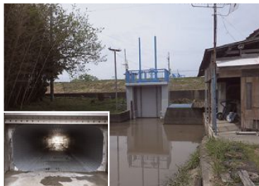
壇ノ前排水樋管補修工事（令和5年度完了）

安定した農業経営や安全安心な暮らしを実現させるため排水機場などの計画的な整備・改修を行い、防災・減災の推進を図ることで自然災害に対する農村の防災力向上を目指します。