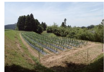
沢田集落（とうもろこしの作付け）

中山間地域等における農業の維持と多面的機能を確保する観点から、農業生産活動を行う農業者等に対して交付金を交付し、耕作放棄地の発生防止など各種対策に取り組みます。