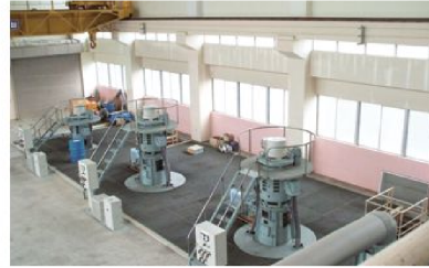
南方揚水機場（機械設備）