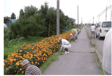
活動の様子（地域環境の保全）

地域住民を含む組織が取り組む、水路・農道等の軽微な補修や植栽による景観形成等の農村環境の良好な保全等、地域資源の質的向上を図る共同活動のほか、施設の長寿命化のための活動を支援します。