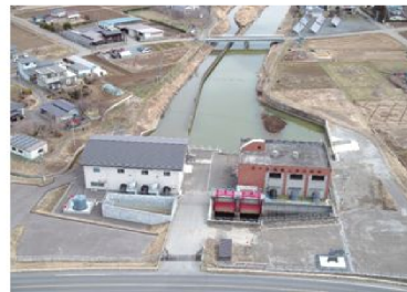
五ヶ村堀第1排水機場及び第2排水機場