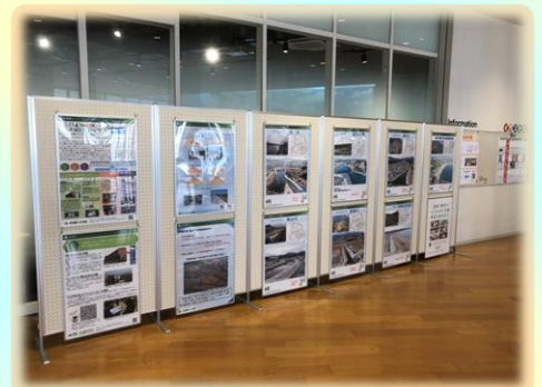
防災砂防課のパネル