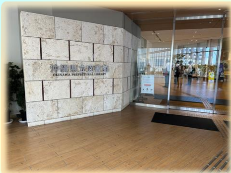
沖縄県立図書館でのパネル展