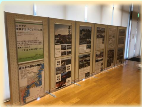
早期復旧に向けた取組と初動対応