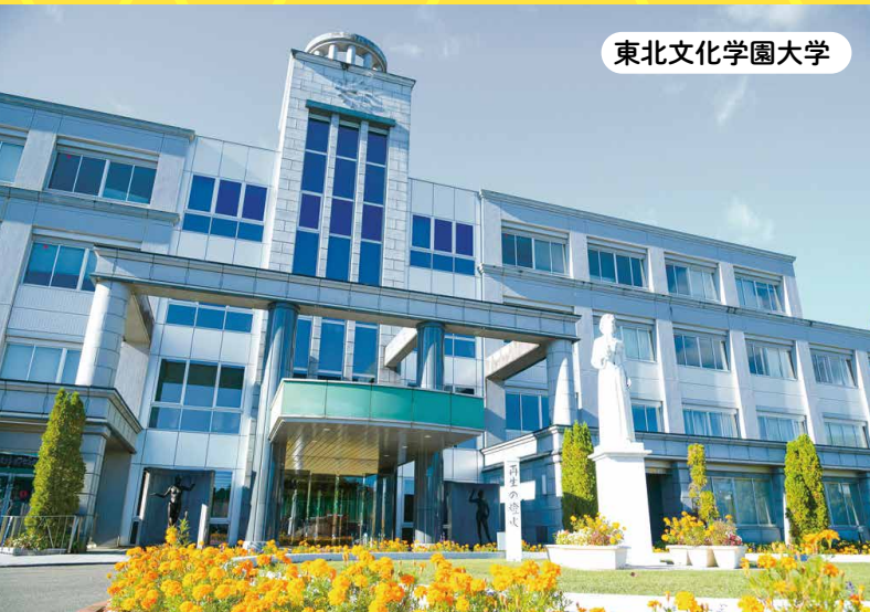
東北文化学園大学