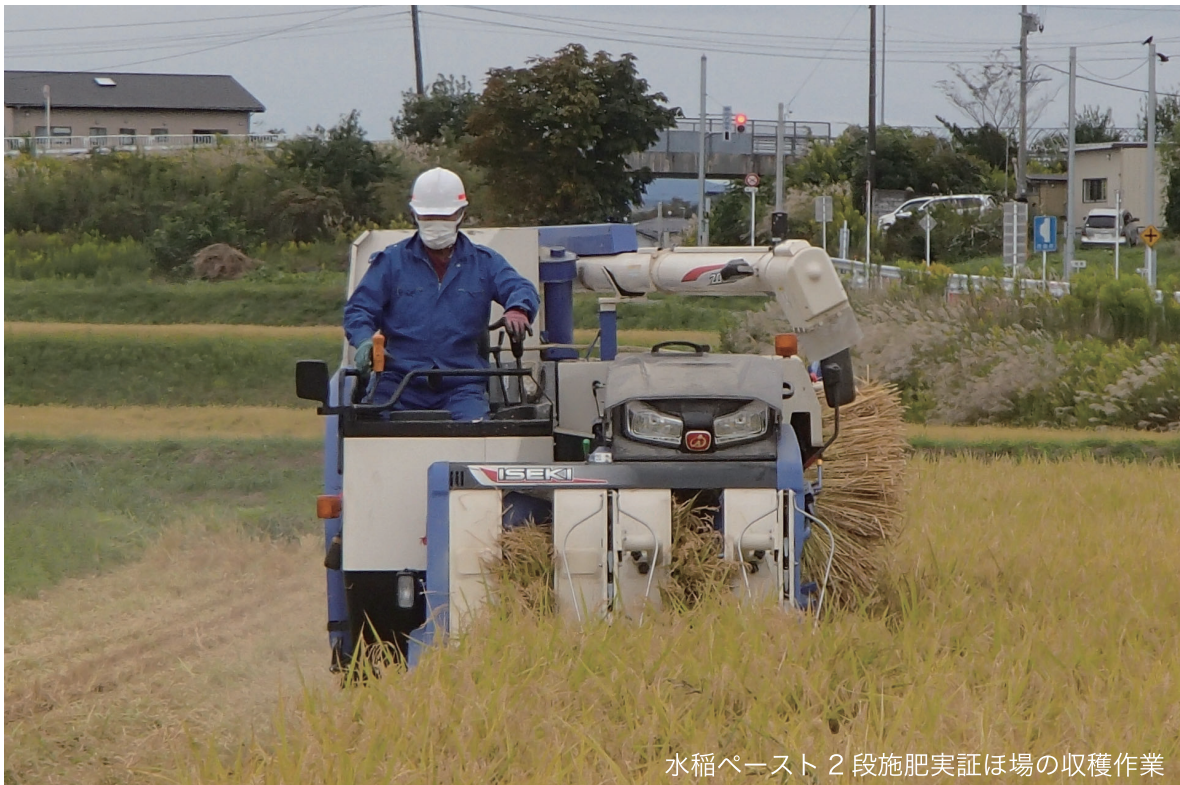
水稲ペースト 2 段施肥実証ほ場の収穫作業