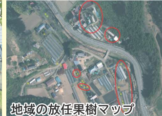
地域の放任果樹マップ