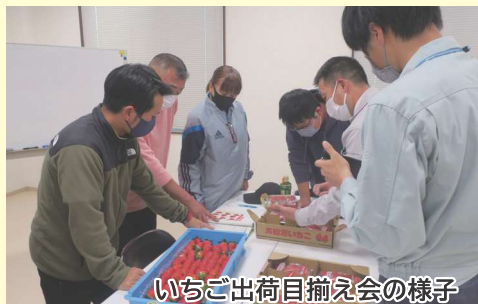
いちご出荷目標揃え会の様子