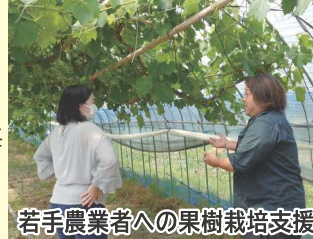
若手農業者への果樹栽培支援

持続的な地域農業を実現するため、機械利用組合の将来ビジョンを策定し、計画的かつ安定した組織運営を支援します。また、集落の将来を担う若手農業者の地域への定着を図るため、部門毎の経営収支を把握し、計画的な営農発展を支援します。