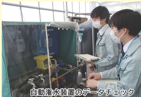
自動灌水装置のデータチェック

また、天敵製剤等の効率的な利用を促し、化学農薬のみに依存しないで栽培を行うIPM（総合的病害虫防除）の導入を支援します。