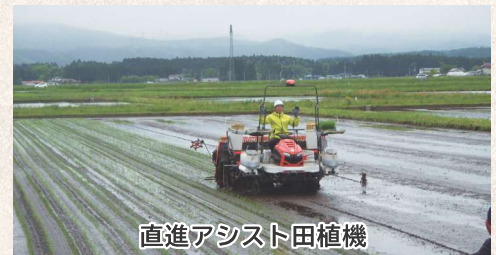
直進アシスト田植機

「効率的な営農に向け、新技術を導入したい」、「すでに導入済みの機材・設備をより効果的に活用したい」など、アグリテックの推進に向け要望がございましたら、お気軽に普及センターまでお寄せください。