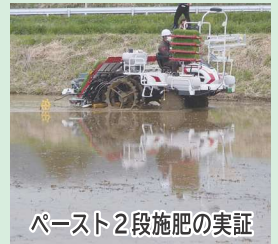
ペースト2段施肥の実証