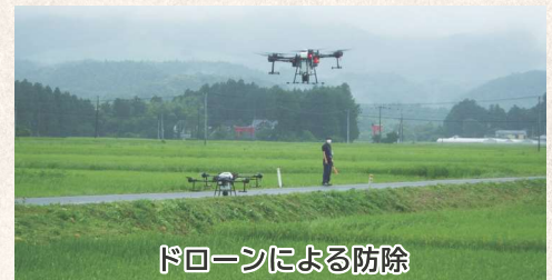
ドローンによる防除