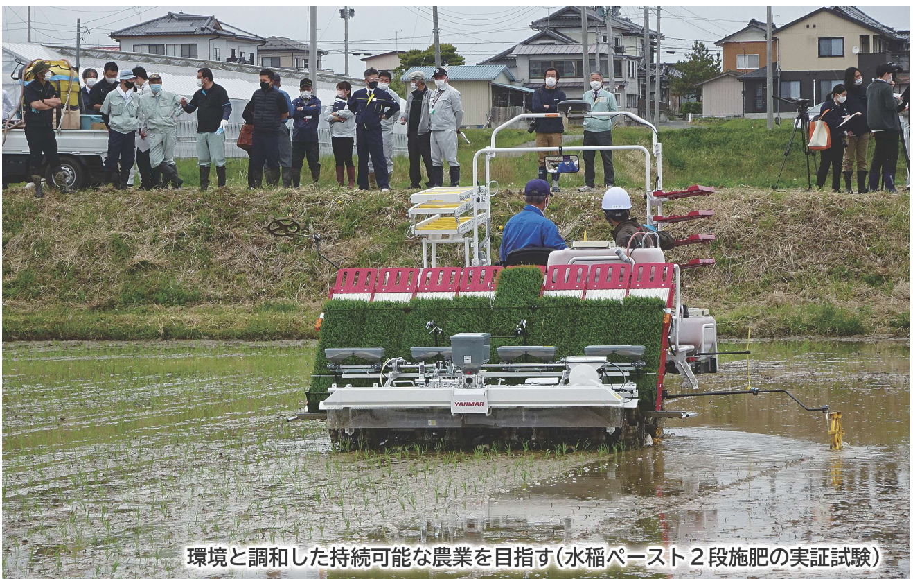
環境と調和した持続可能な農業を目指す(水稻ペースト2段施肥の実証試験)