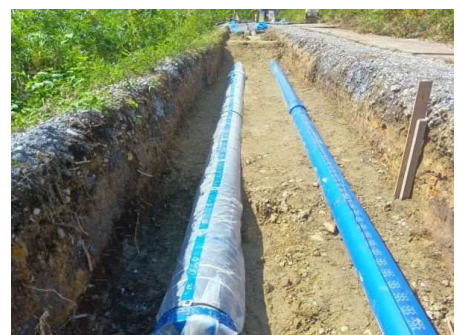
新設管路布設状況（県、大崎市）