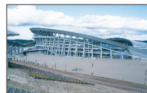
<例:大会・合宿等の県内誘致促進>

宮城の魅力発見、団体旅行の増加や地域経済活性化等様々なメリットがあるスポーツツーリズムを推進するため、県内へのスポーツ合宿等の誘致を目的としたバス助成金を交付する。