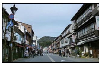
<例:無電柱化による歩行者の利便性向上>

観光地の景観整備、地域の核となる観光施設整備、集客効果が高い施設整備に対する支援を行う。