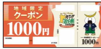
<例:地域限定クーポンによる消費喚起>

閑散期や長期滞在促進に向けたインセンティブとするとともに、地域の土産店、飲食店等での地域クーポンの利用により、地域経済活性化を促進する。