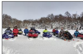
<例:地域資源を活かしたコンテンツ造成>

地域の特色を生かした観光地域づくりを安定的に実施するため、市町村が行う観光振興施策への助成を行う。