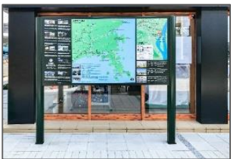
<例:多言語観光案内板の整備>

観光地内での快適な旅行環境の整備に向け、観光施設における多言語対応や、Wi-Fi環境の整備促進を支援する。