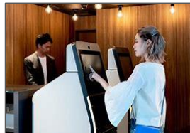
<例:スマートチェックインシステムの導入>

おもてなし態勢の向上を目指し、省力化やサービス水準の向上につながる設備導入経費への助成を行う。(例:清掃ロボット、宿泊施設管理システム、スマートチェックイン)