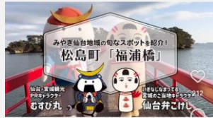
SNSを活用した情報発信