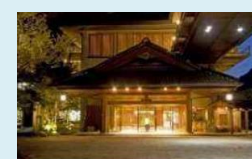
宿泊施設の生産性向上

2024年3月消費者物価指数総合指数が2020年100に対し107.2に上昇する等コスト高による収益悪化が懸念