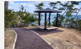
気仙沼大島龍舞崎園地