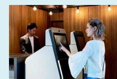
省人化機器の導入