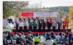
オープニングイベント