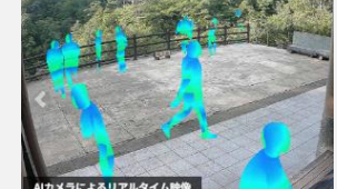
混雑状況可視化の様子