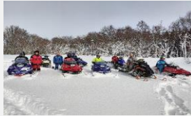
地域資源を活用したコンテンツ造成