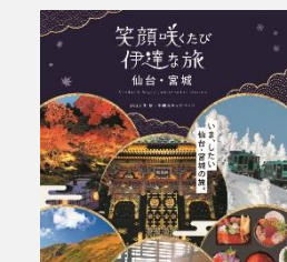
2023年秋・冬観光キャンペーンガイドブック