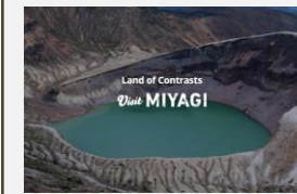
Visit MIYAGI WEBサイト

WEBサイト「Visit MIYAGI」を活用したインバウンド向けの情報発信の充実や、県政150周年記念観光キャンペーン、秋冬観光キャンペーン等を実施