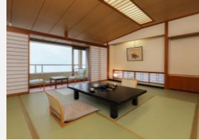
高付加価値化改修（鳴子温泉郷）