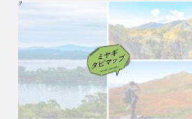
観光用デジタルマップ

観光地内での周遊を促進するために、観光施設や周辺駐車場の混雑状況を計測し、観光用デジタルマップで情報発信