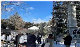
教育旅行誘致促進（モニターツアー）