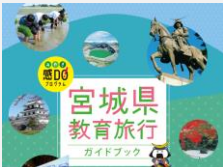
宮城県教育旅行ガイドブック