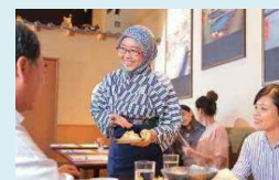
外国人労働者の雇用