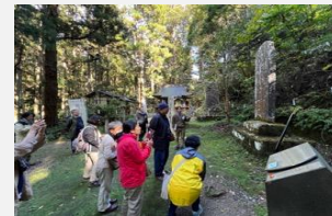
実践模擬ツアーの様子