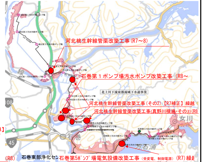
北上川下流東部流域下水道(北上川下流東部処理区)

備考:全体計画~R17,認可計画~R8 計画処理人口,計画処理水量は減少するため, R17の全体計画値は現時点よりも小さくなる。