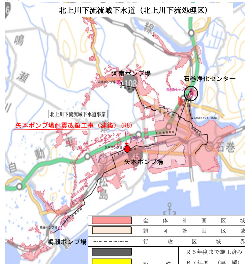
石巻浄化センター一般平面図

【補助事業(交付金事業)】 事業費 C=1,011百万円 (うち令和7年度繰越分 C=148百万円)