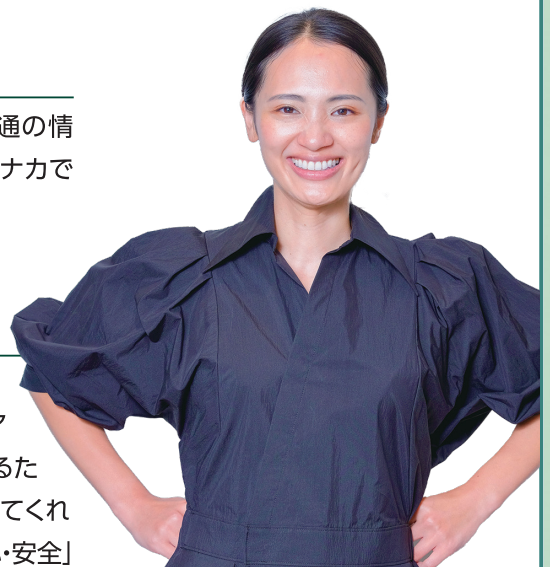
株式会社ピースポーク

2011年は、「見えない不安」と多言語での「間違っただ情報」が大きな混乱を招き、日本の危機管理体制の課題が浮き彫りになりました。「リアルタイム性」が求められる緊迫した環境において「安心・安全」を届けるために始まったのが、私達のプロジェクトです。そこに「地元の人が案内してくれているような安心感」を追加したのが、旅行者向け「Bebot」です。「安心・安全」そして「特別な体験」をスマホ1つで再現します。