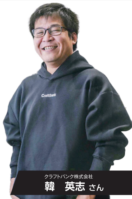
クラフトバンク株式会社

地域インフラを支える中小建設業が持続的な事業運営を図るべく、『事務作業のDX』という切り口で、建設業の労働環境の改善を通じた生産性向上を実現していきたいと考えています。