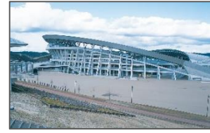
<例:大会・合宿等の県内誘致促進>

宮城の魅力発見、団体旅行の増加や地域経済活性化等様々なメリットがあるスポーツツーリズムを推進するため、県内へのスポーツ合宿等の誘致を目的としたバス助成金を交付する。