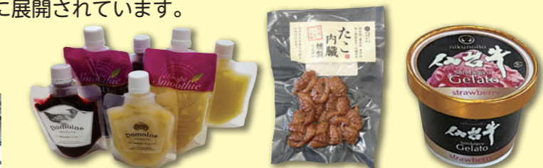
規格外品や廃棄されていた材料を活用した商品開発