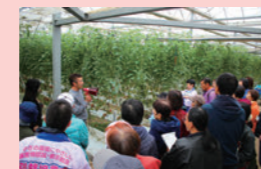
生産者との交流による消費者の理解促進