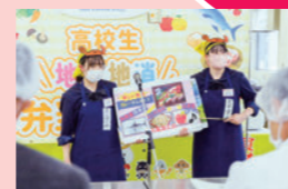
食育・地産地消の推進