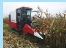
県産飼料作物の増産