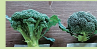
高温によるブロッコリーの異常花蕾(左)と正常花蕾(右)