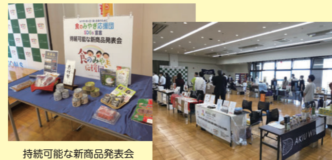
持続可能な新商品発表会