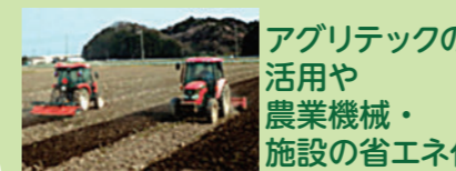
アグリテックの活用や農業機械・施設の省エネ化