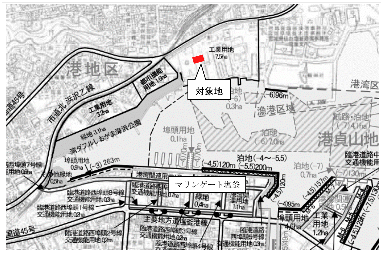
仙台塩釜港（塩釜港区）港湾計画平面図（平成25年改訂）