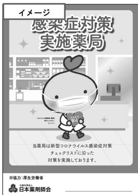
みんなで安心マーク

日本薬剤師会では、新型コロナウイルス感染が拡大している状況下でも、患者さんが安心して薬局に 来局できるよう『新型コロナウイルス感染症等感染防止対策実施薬局 みんなで安心マーク』を作成し、 感染防止対策を徹底し、チェックリストを満たした薬局に向け、発行できるよう準備を進めています。 詳細は9月上旬～中旬にも本会のホームページにて、ご案内する予定です。