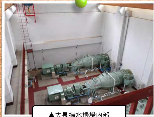
▲大泉揚水機場内部