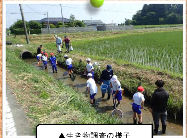
▲生き物調査の様子

また、これから夏休みを迎えるため、農業用水路や農業用ため池の危険性についてパネルを用いて説明を行いました。子供たちは真剣なまなざしで話しを聞き、子供だけで水路やため池には近づかないことを約束しました。