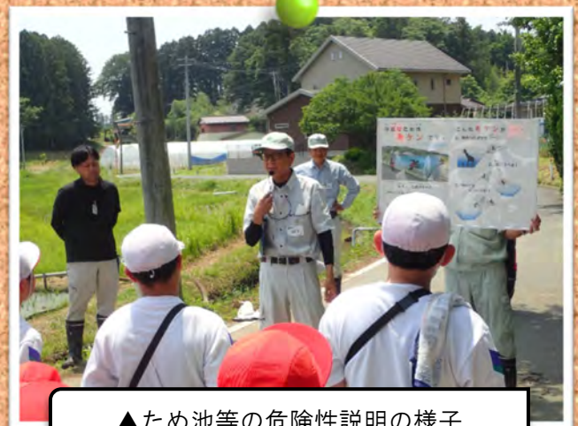
▲ため池等の危険性説明の様子