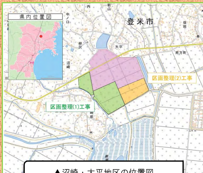
▲沼崎・大平地区の位置図

今後、順次整備を進め、令和9年度の事業完了に向けて区画整理、揚水機場及び暗渠排水の整備を実施してまいります。