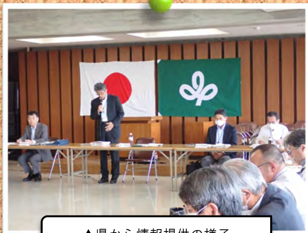
▲県から情報提供の様子

その後の意見交換では、農業水利施設の長寿命化計画や、補助事業における地元負担率、ほ場整備事業の計画的な事業推進など関係土地改良区及び登米市からの意見要望に対して、関係部署よりそれぞれ回答を行いました。