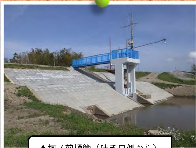
▲壇ノ前樋管（吐き口側から）

そのため令和3年度から農業用河川工作物等応急対策事業「壇ノ前地区」として、樋管本体の内面補修やゲート、護岸の補修工事を行い、令和5年度末に全ての工事が完了しました。