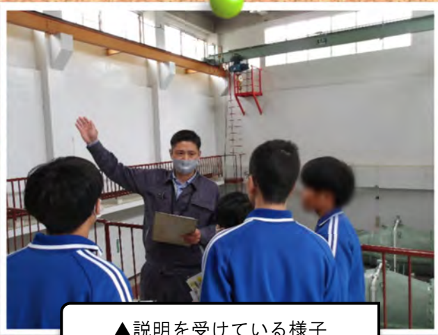
▲説明を受けている様子

今回の施設見学は生徒の皆さんにとって、土地改良区の仕事や農業水利施設の大切さについて理解を深める良い機会になったのではないのでしょうか。