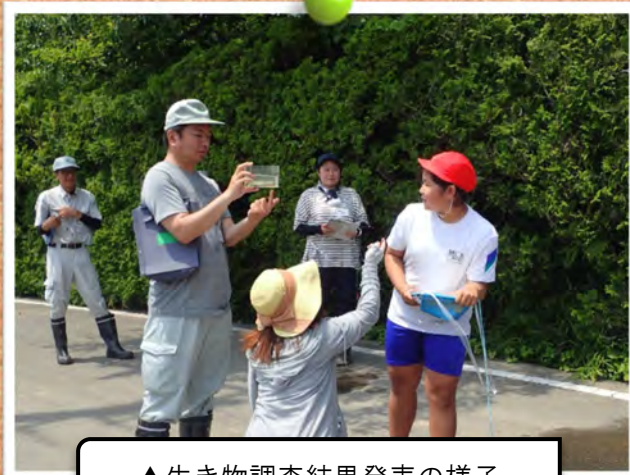
▲生き物調査結果発表の様子

当部では、これからも「田んぼの学校」を継続し、子供達の農業・農村に関する学習を支援していきます。