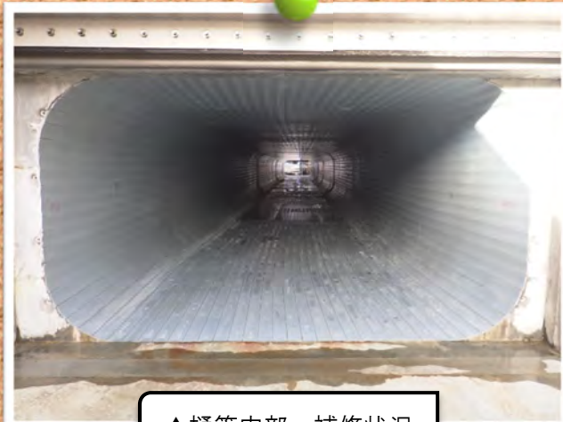
▲樋管内部 補修状況