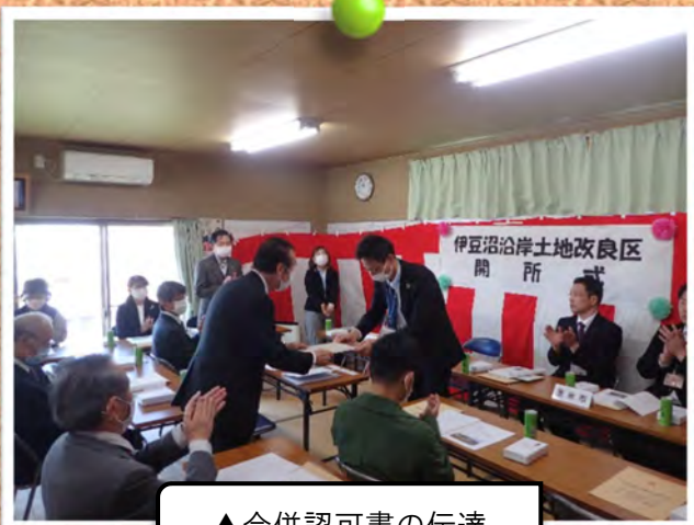
▲ 合併認可書の伝達