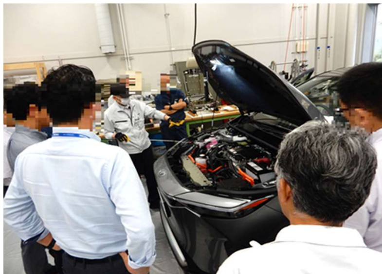
R5年度 自動車部品機能・構造研修