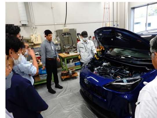
自動車部品機能・構造研修事業 (R5年度 講座3: 電動車基礎編)