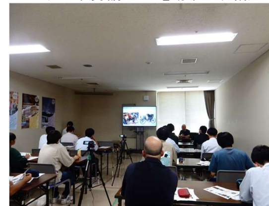
みやぎカーインテリジェント人材育成センター事業 (R5年度 B1講座:「自動車産業概論」講座)