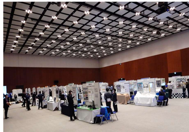
R5年度 とうほく・北海道 自動車関連技術展示商談会