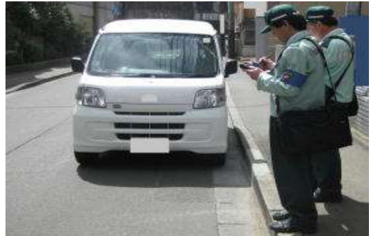
【交通の円滑化に欠かせない駐車監視員】

また、取締り活動ガイドラインについては、定期的な見直しを行い、常に警察署管内における違法駐車の実態を反映したものになるように努める。このほか、駐車監視員による放置車両の確認等に関する事務の適切かつ円滑な運用、悪質な運転者に対する責任追及の徹底、放置違反金制度による使用者責任の追及等に努めることにより、地域の駐車秩序の確立を図る。