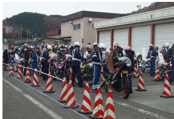
【交通秩序を乱す旧車會にはあらゆる法令を適用して検挙】

等を連ねて大規模な集会や走行を行うなど、迷惑性が高い行為もあることから、その実態の把握に努めるとともに、各種法令を適用して徹底した取締りを行う。