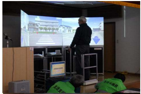
【歩行環境シミュレーターの活用】

高齢者に対しては、運転免許の有無等により、交通行動や危険認識、交通ルール等の知識に差があることに留意しながら、加齢に伴って生じる身体機能の変化が道路における交通行動に及ぼす影響や走行車両の直前直後横断等、高齢歩行者側にも原因がある死亡事故が多いことを理解してもらうよう努める。