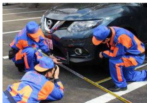
【綿密な鑑識作業を行う交通事故捜査員】

科学的な交通事故事件捜査を推進するため、各種交通鑑識資機材に加え、防犯カメラやドライブレコーダー等の映像を効果的に活用するとともに、各種資機材の整備を進める。