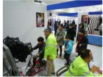
【自転車シミュレーターの活用】

学校、教育委員会、関係機関・団体等との連携を強化し、児童・生徒に対する自転車安全教育を強力に推進するとともに、自転車シミュレーターの活用等による参加・体験・実践型の自転車教室を開催するなど、教育内容の充実を図る。