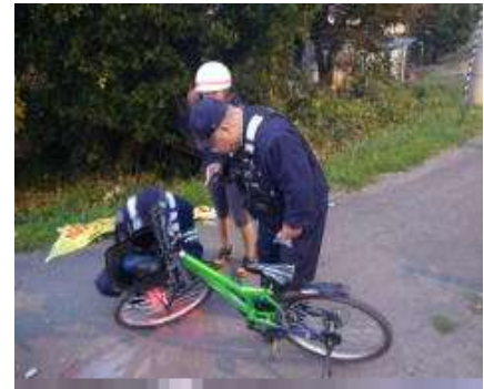
【自転車に対する普及促進】