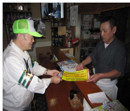
【飲酒運転根絶活動推進委員の活動】

宮城県飲酒運転根絶に関する条例（平成19年宮城県条例第86号）の制定趣旨の周知徹底を図るとともに、各種施策等を積極的に推進するほか、自治体や事業所等の再発防止対策を推進するための指導・助言を積極的に行う（飲酒運転に係る情報提供等）。