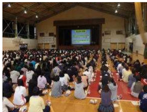
【加入阻止教室で学んだ「暴走しない させない 見に行かない」】

暴走族への人的供給を遮断するため、中・高校生を対象とした暴走族加入阻止教室を開催し、暴走族の危険性・悪質性について理解を深めさせるなど効果的な暴走族加入防止対策を推進する。