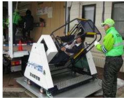
【シートベルト体験】

後部座席を含めた全ての座席におけるシートベルト着用の徹底を図るため、市町村や旅客運送事業者等を始めとする関係機関・団体等と連携し、各種講習等のあらゆる機会及び各種広報媒体を活用して、広報啓発を図るほか、交通指導取締りを推進する。