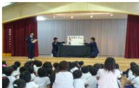
【幼児に対する交通安全教育】

幼児に対しては、交通ルールや交通マナー等、道路の安全な通行に必要な基本的な技能及び知識の習得を目的に、幼稚園、保育所、認定こども園等と連携して、紙芝居や視聴覚教材等を活用した交通安全教室等の実施に努める。