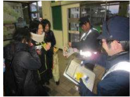
【歩行者に対する普及促進】

さらに、衣服や靴、鞆等への反射材の組み込みを推奨するとともに、適切な反射性能を有する製品についての情報提供に努める。