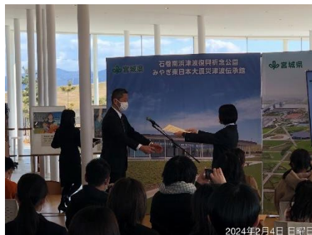
昨年度授賞式の様子（令和6年2月4日）

受賞作品は、県内伝承施設等に配布する災害伝承の啓発ポスターなどに使用するほか、県内施設やみやぎ東日本大震災津波伝承館等で展示するなど、災害伝承の広報・啓発に幅広く活用します。