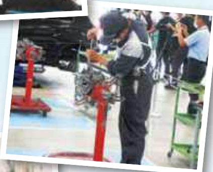
自動車整備技能コンクール