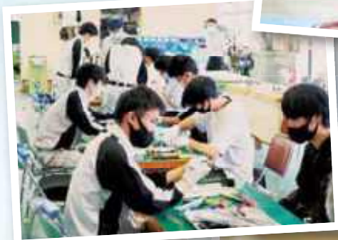
オープンキャンパス