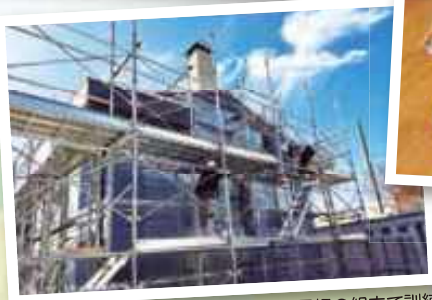
足場の組立て訓練