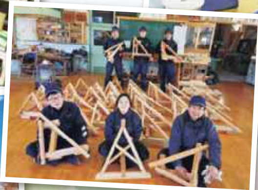
木の家づくり技能検定対策