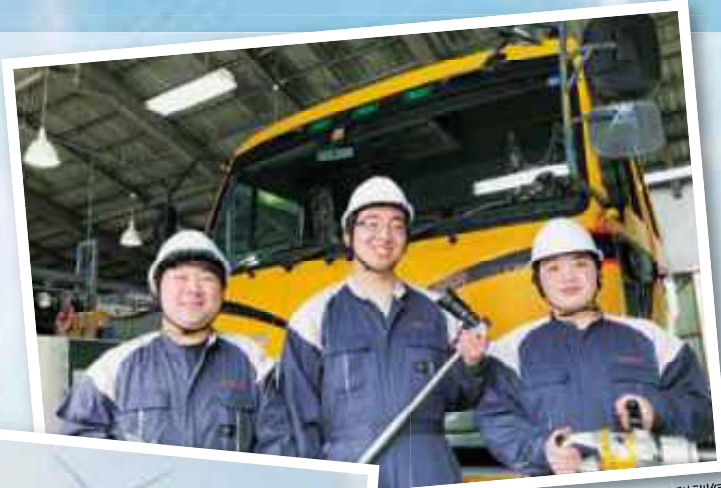
自動車整備科訓練