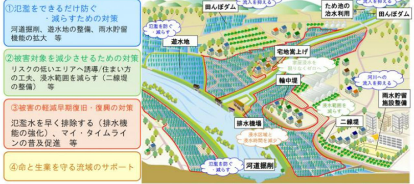
<吉田川および高城川で取り組む流域治水のイメージ>

特定都市河川に指定することで、河川整備を加速するとともに、水害リスクを踏まえた土地利用や流出抑制対策等に係る新たな予算・税制等も活用し、「地域を“みず”から守る」流域治水を推進していきます。