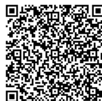
スマイルサポーター について

サポーターの皆様には、猛暑の中、美化活動いただきありがとうございました。今後も活動状況を紹介するなど皆様の活動を支援していきますので、今後ともよろしくお願いいたします。