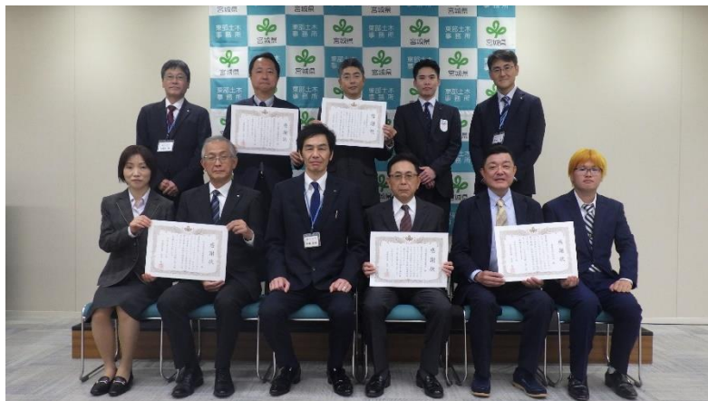
令和6年度知事感謝状贈呈式