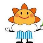
気象庁マスコット「はれるん」