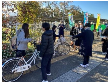
<仙台三桜高校での様子>

登校の際には、時間に余裕を持って出発するとともに、ヘルメットを着用し、安全第一で運転してください。