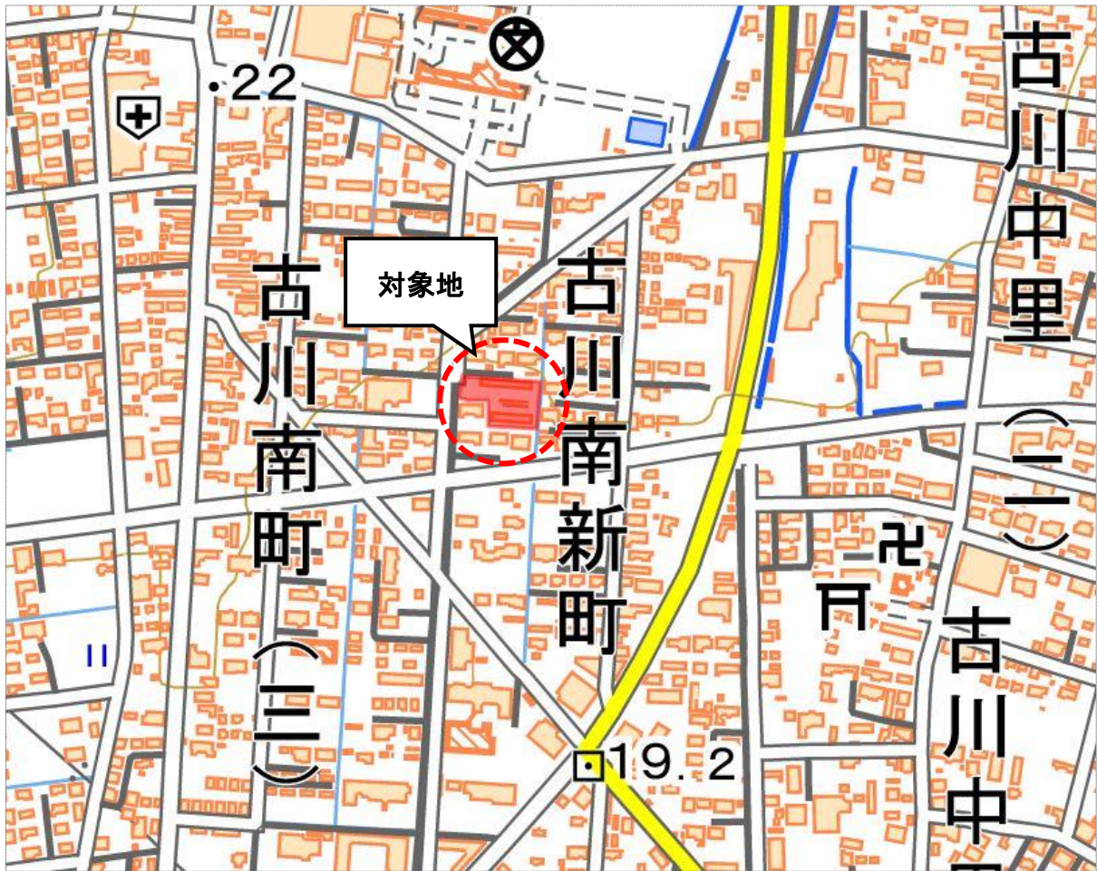
地理院地図（電子国土web）を基に作成< https://maps.gsi.go.jp/index.html >