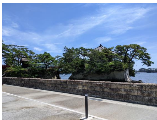
（中央広場にて撮影）