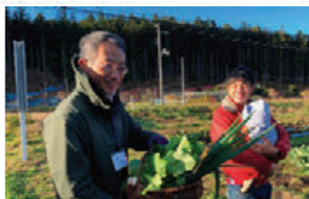
交流人口拡大に向けた都市農村交流活動