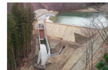
防災重点農業用ため池の地震・豪雨対策工事