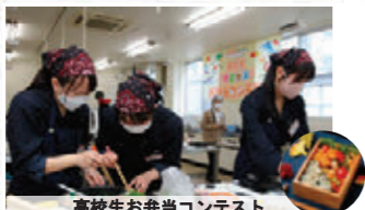
高校生お弁当コンテスト