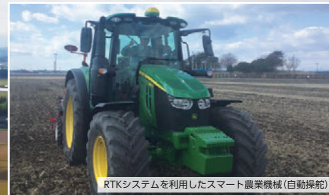
RTKシステムを利用したスマート農業機械(自動操舵)