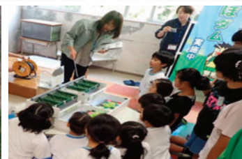
田んぼダム普及拡大のための出前授業