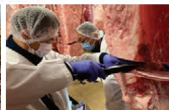
脂肪の質に優れた牛群改良(測定の様子)