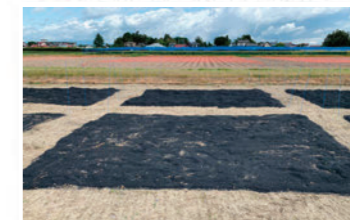
環境負荷低減に向けた試験研究(パイオ施設用)