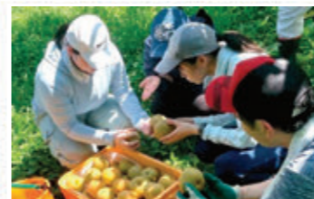
多様な人材を活用した地域の取組支援(みやぎINAKAゼミ)