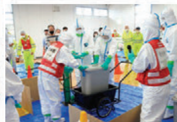
特定家畜伝染病発生時に備えた防疫演習