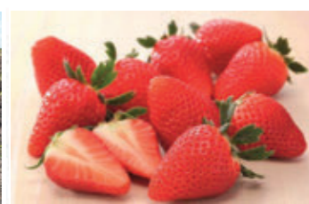
宮城県オリジナル品種「にこにこベリー」