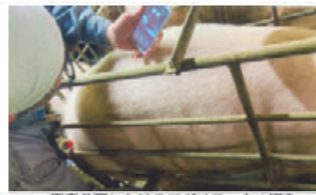
畜産分野におけるアグリテックの導入(動物用超音波画像診断装置)