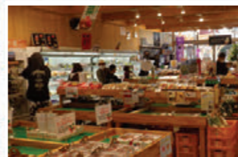
地域課題解決に向けた農産物直売所の機能強化