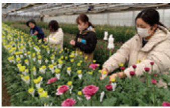
新規就農者拡大に向けた農業体験ツアー