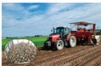
需要に応じた加工用ばれいしょの生産