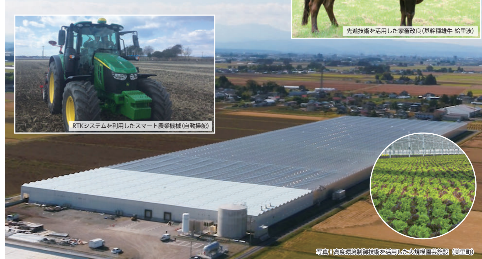
写真:高度環境制御技術を活用した大規模園芸施設(美里町)