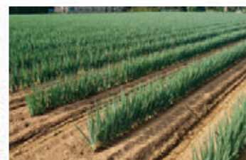
水田フル活用による園芸作物への転換(ねぎ)