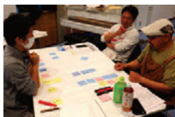
なりわい創出に向けた人材研修