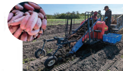
実需者と連携した生産拡大(かんしょ)