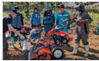
女性農業者のための農業機械セミナー