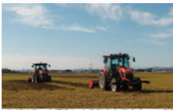
アグリテック導入による無人トラクターの走行