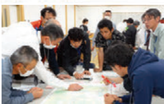
地域農業の未来設計図「地域計画」の策定