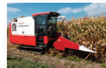
子実用トウモロコシの生産