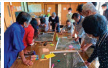
鳥獣被害防止に向けたワークショップ