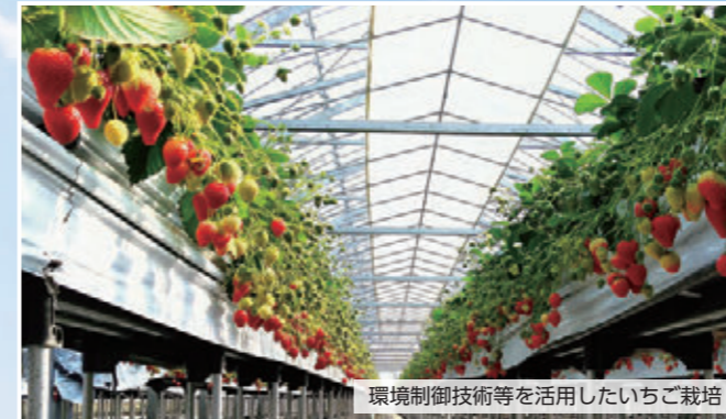
環境制御技術等を活用したいちご栽培