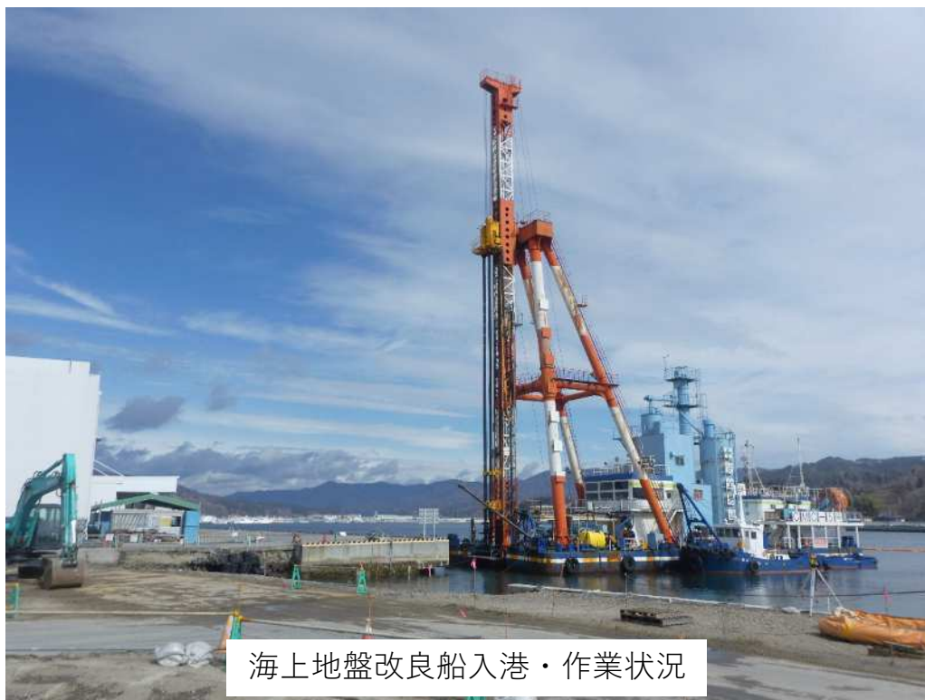
海上地盤改良船入港・作業状況