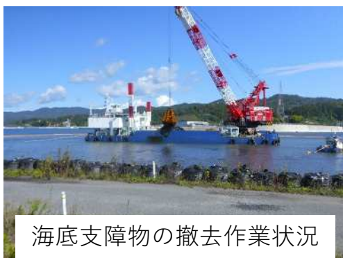
海底支障物の撤去作業状況