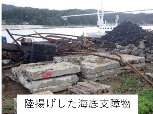
陸揚げした海底支障物