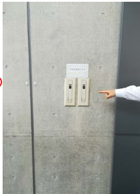
稼働ボタン(排煙用オペレーター)