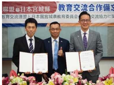
覚書締結式(教育省本部・台北市) 台湾教育部 政務次官、高級中等以下学校国際教育交流連盟の執行長、副執行長及び全11エリア処長等が参加