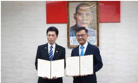
令和6年4月17日覚書交換式(台北市政府庁舎・台北市)