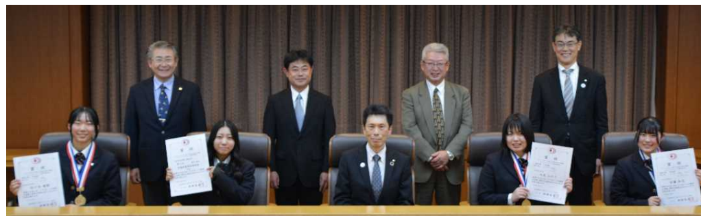
「レディースカップ第16回全日本女子選抜ウエイトリフティング選手権大会」による表敬訪問