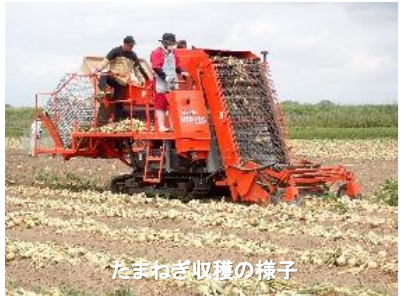
たまねぎ収穫の様子