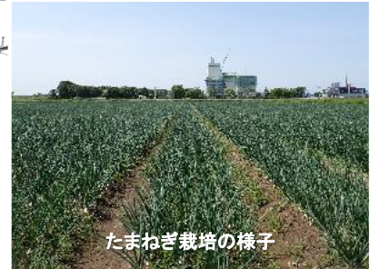
たまねぎ栽培の様子