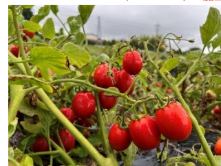
写真②(R7.8.6撮影) 加工用トマトの収穫作業