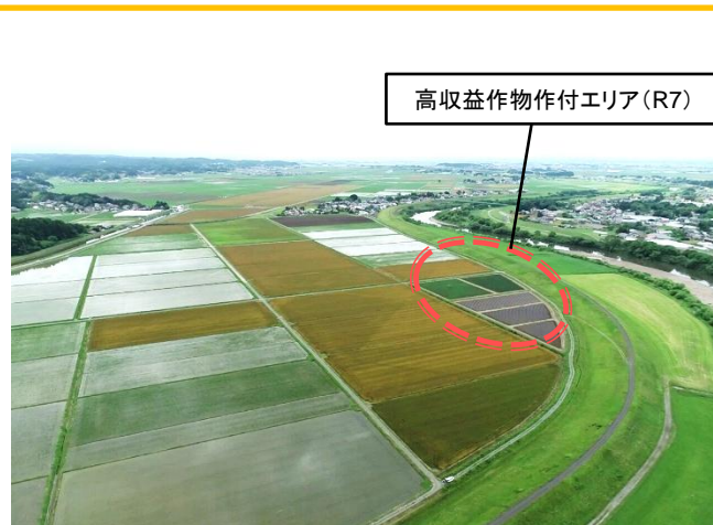
高収益作物作付エリア(R7)